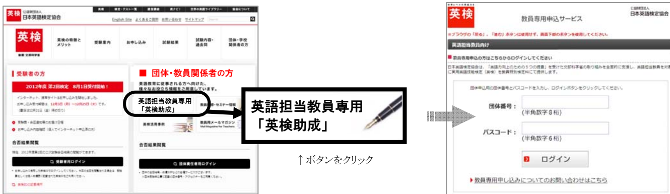
↑ ボタンをクリック

英検ウェブサイト ( http://www.eiken.or.jp/eiken.html ) に開設される教員専用申込みページより、手順1で用意した「英検団体番号」、「教員助成用パスコード」を入力してログインします。